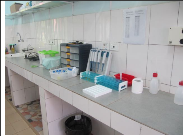
FOTO LABORATORIO ANALISI KOUDOUGOU